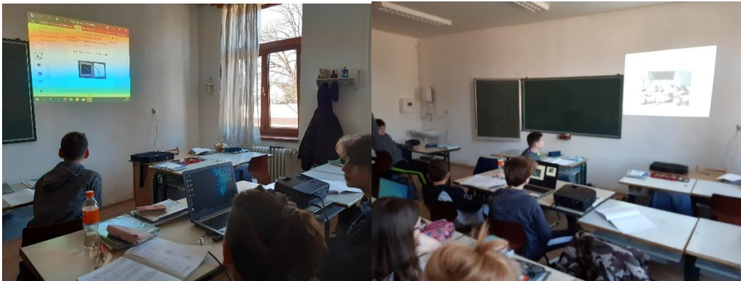
Die bisher gesammelten Einrichtungen